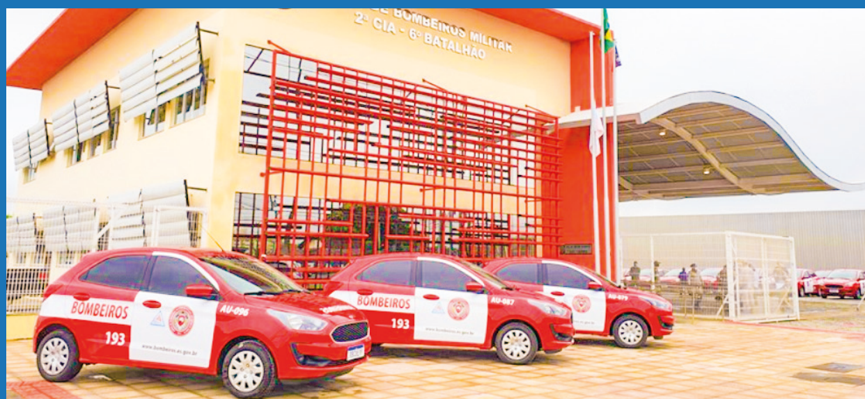
Nova sede do Corpo de Bombeiros na Serra, inaugurada recentemente

Durante a prestação de contas do governador na Assembleia Legislativa, Renato Casagrande anunciou que vai criar concursos para a contratação de policiais militares, policiais civis e bombeiros em 2021.