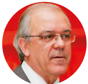
Por Guilherme Henrique Pereira

Já em circulação muitos artigos sobre avaliações e proposições de como será o mundo no pós-pandemia em vários campos: atitudes, políticas de governos, impulsos para negócios digitais e inovadores para serem praticados e iniciados. Predomina a visão de que esta será a maior crise da história do capitalismo mundial. Na atividade econômica, havia previsões de tombos expressivos no PIB de todos os países, excetuando-se a China. Neste final de ano, observamos avaliações menos pessimistas e até razoavelmente otimistas para um número maior de países além de China.